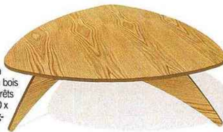
Table basse sans clou ni vis à commander sur mesure. En bois multipli de bouleau provenant de forêts durablement gérées. À partir de 80 x H 35 cm, 390 €. "Trio", Cutting- Edge pour L'Édito.

Inspirée Peinture 100 % biodégradable composée de matières premières renouvelables. Sans COV. Même l'emballage est recyclable. 15 teintes. 41 € les 2,5 L. Ushuaïa by Bondex.